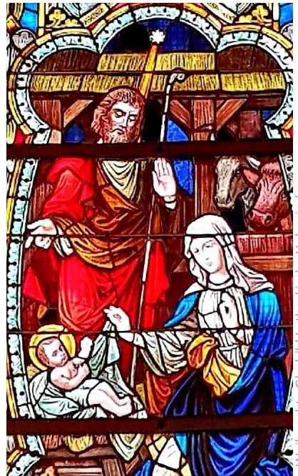
Weihnachts-Glasbild Lutherkirche Holzminden